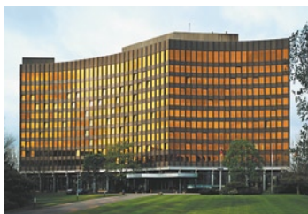
Köln – Gustav-Heinemann-Ufer