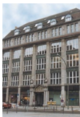
Berlin – Wallstraße